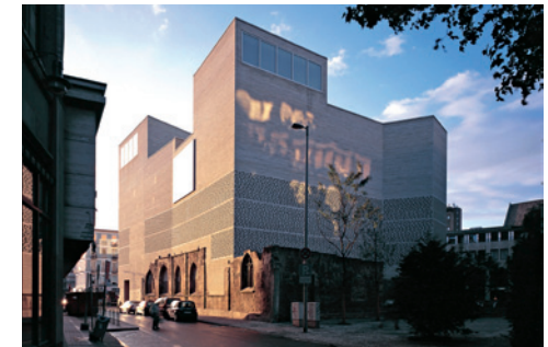
Kolumba Köln