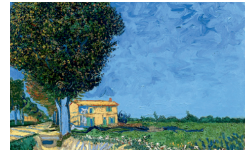
Vincent van Gogh, Allee bei Arles, 1888, Öl auf Leinwand