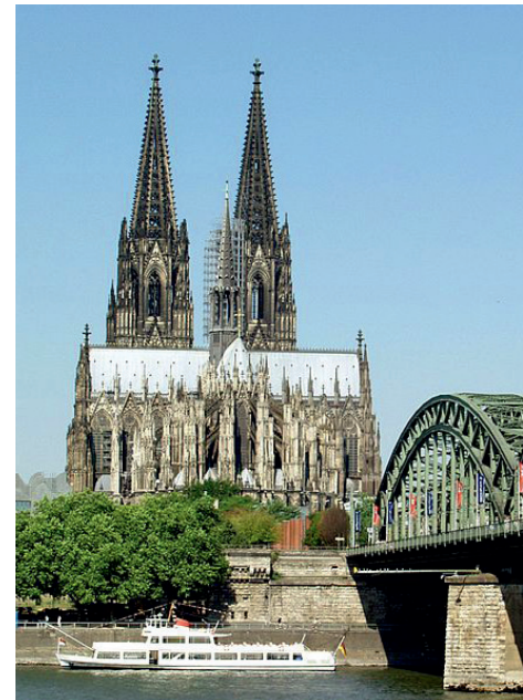
Kölner Dom

Nach der individuellen Mittagspause trifft man sich, um einer der wichtigsten Kölner Kirchen der Romanik zu huldigen: die monumentale Groß St. Martin. Zum Abschluss umrunden Sie mit Michael Wenger den Kölner Dom. Am Nachmittag treten wir die Rückreise nach Süden an.